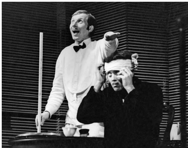
Sean O'Casey: Pension pro svobodné pány (ČK 1965)

„ Jiří Krejčík . V roce 1964 jsme pro televizi zkoušeli první verzi Pensionu pro svobodné pány s Jiřím Menzelem, Jiřinou Jiráskovou a paní Věrou Ferbasovou v režii Jiřího Krejčíka. Pension byla vtipná, krátká povídka, stačilo ji natočit. Ne tak pan režisér Krejčík. V každé větě, v každé situaci se skrývalo velké množství řešení... Byl jsem nadšen a překvapen objevem, že tento seriózní pán a postrach herců dokáže řvát smíchem a padat ze židle, třeba i nad jedním slovem, intonací, objeveným gagem. Jeho recesistická minulost opět rozkvetla. Radost z improvizace a rozvíjení dialogů a situací nás všechny vedla k neomezené svobodě a gagy a nádherné blbosti jsme nestačili třdit. Premiéra v televizi měla úspěch a Jaroslav Vostrý nám překvapivě umožnil zahrát tuto – mimo divadlo nacvičenou věc – před našimi diváky. Bylo to odvážné a skvělé rozhodnutí. Divadlo předvedlo, že i tento žánr k nám patří. Je to lví podíl pana režiséra Krejčíka na barevnosti Činoherního klubu.“