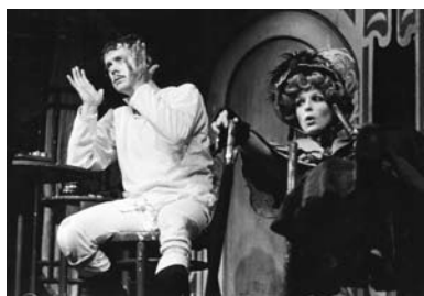
Sean O'Casey: Pension pro svobodné pány (ČK 1975)