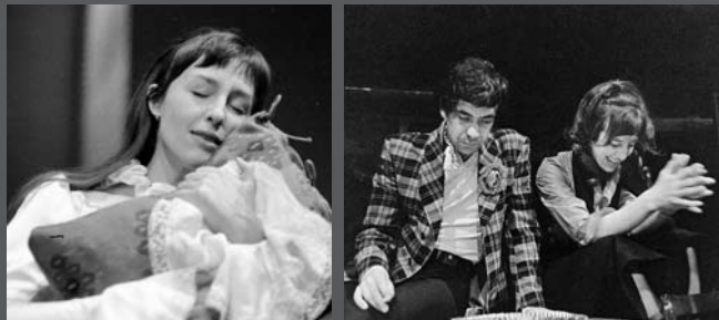
A. P. Čechov: Višňový sad (Charlotta, 1969); M. Gorkij: Na dně (Vasilisa, 1971)

Nikdo z mužů, které jsem za svůj život mohla poznat, se tátovi nevyrovnal, a nejspíš už ani – s prominutím – nevyrovná. Nikdy jsem nezažila, že by se Tunal, jak mu všichni říkali, někdy chlubil. Věřím, že se na mě nebude zlobit, když se s ním teď, padesát sedm let po jeho smrti, pochlubím já. (...)“