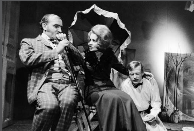
A. P. Čechov: Višňový sad (Raněvská, 1969)