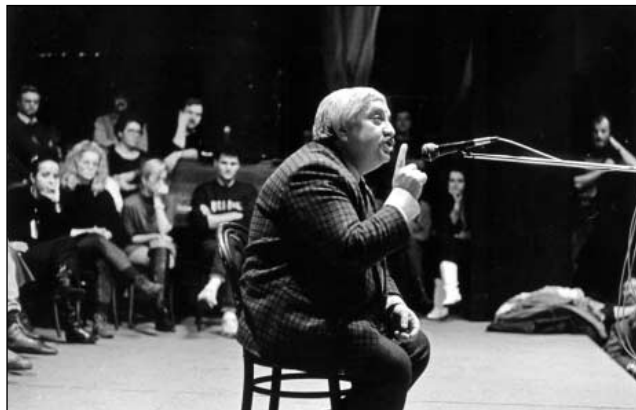
Listopad 1989 – Činoherní klub