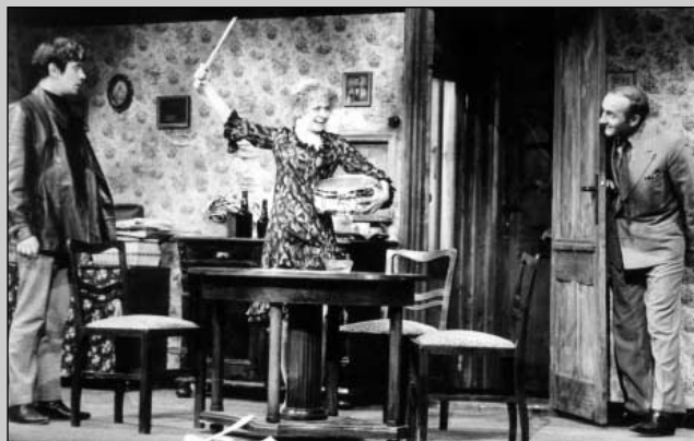
H. Pinter: Narozeniny (r. J. Vostrý, 1967, P. Čepek, J. Třebická, J. Somr)

(Úryvek z textu Divadlo pojaté jako klub, in Činoherní klub 1965-2005)