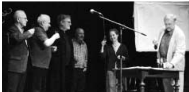
Kmotry byli Jaroslav Vostrý, Luboš Hruza, Jan Kačer a Těňa Fischerová.

■ Jan Vodňanský a Petr Skoumal pokřtili 30. března v Činoherním klubu své 4CD Život a dílo .