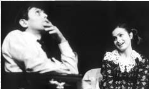
E. O'Neill: Cesta dlouhého dne do noci (Cathleen, režie L. Smoček, 1978)