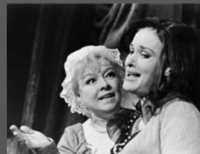
N. Machiavelli: Mandragora (režie J. Menzel, 1965; s J. Břežkovou)