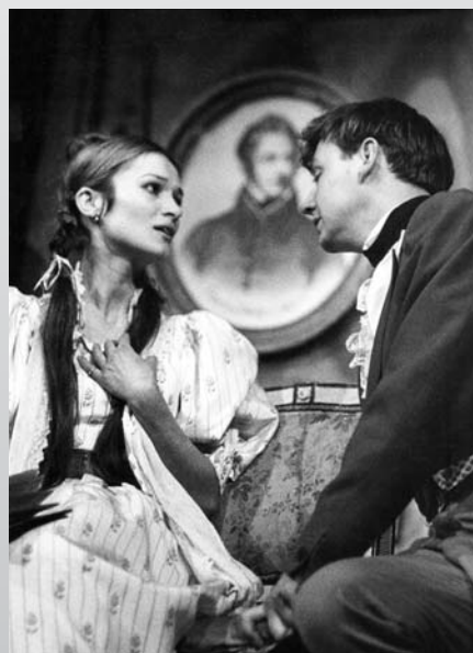
N. V. Gogol: Revizor (režie Jan Kačer, 1967, s Olegem Tabakovem při jeho hostování v r. 1968)