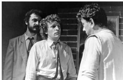
Sam Shepard: Pravý západ (1990 / s D. Prachařem a P. Čepkem)