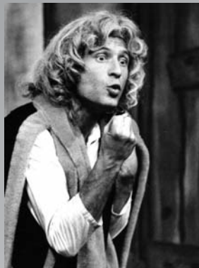
J. Vostrý: Tři v tom (r. Jiří Menzel, ČK 1978; Ubaldo)

„Proč se Jiří Kodet uměl bez velkých potíží vnitřně smířit i s menšími rolemi? Nehrál přece ani v Činoherním klubu jen pseudodandyovského Chlestakova z Gogolova Revizora nebo Barona z Gorkého Na dně , cynického Jašu z Čechovova Višňového sadu či tak rozdílné otce, jaké představují Ubaldo ze Tří v tom a Peachum z Havlovy Žebrácké opery , o jeho frustrovaném hraběti Šabelském z Čechovova Ivanova nemluvě... Důvodem nebyla (jenom) nějaká přirozená ukázněnost či pokora, ale schopnost se – a s velkým půvabem – projevit s celým svým ‘jástvím’ také v nich. Dovedl to předvést i v ži-