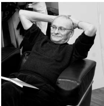
Fotografie ze zkoušky