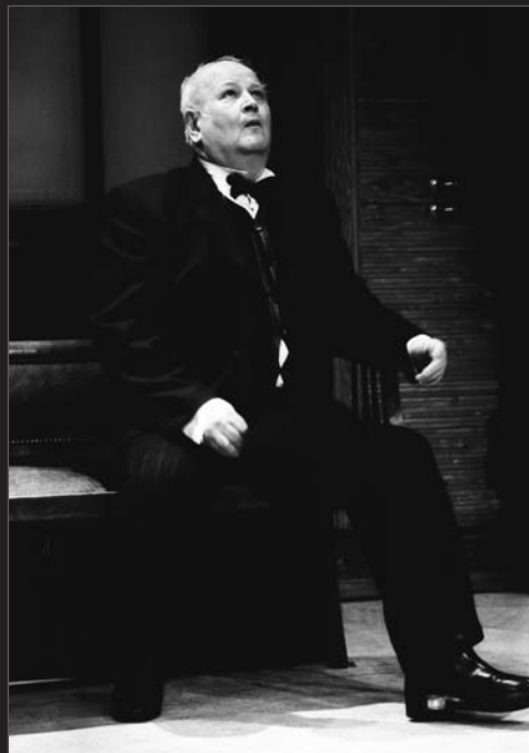
Stock ze Zweibrücku ve Štechově Deskovém statku

Starý učitel v Kunderově Ptákovině (režie L. Smoček, 2008)