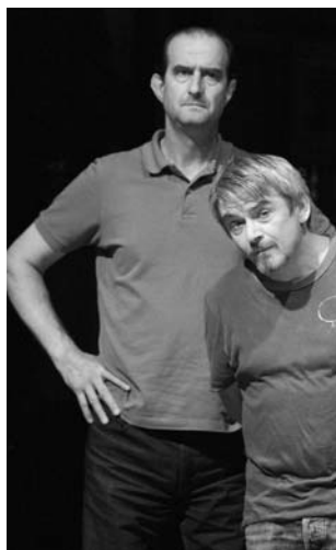
Foto ze zkoušek