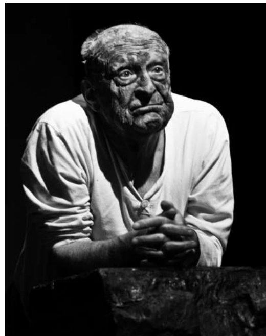
F. Mitterer: Moje strašidlo (režie Martin Čičvák, ČK 2010)