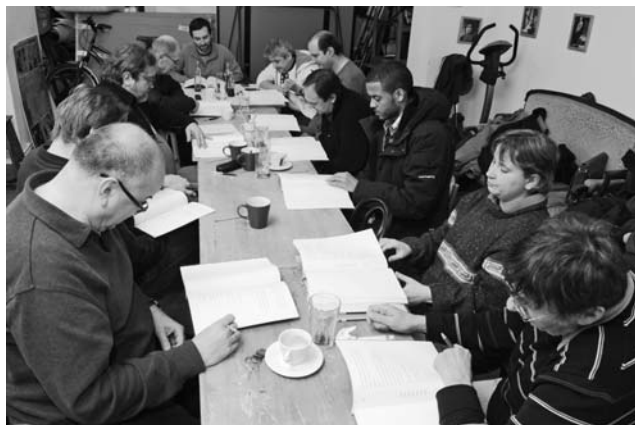
První čtená zkouška 7. března 2011