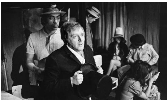
A. Vostrá: Na ostří nože (režie J. Vostrý, 1968)