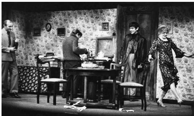
H. Pinter: Narozeniny (režie J. Vostrý, 1967)