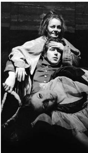
Voltaire: Candide (r. J. Vostrý, 1971)