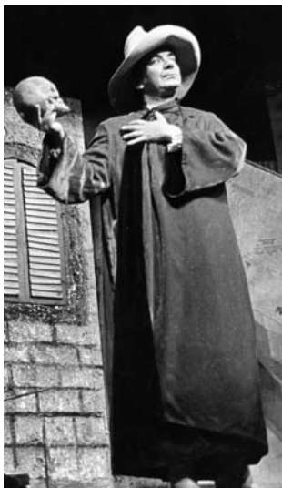
J. Vostrý: Tři v tom (r. J. Menzel, 1978)