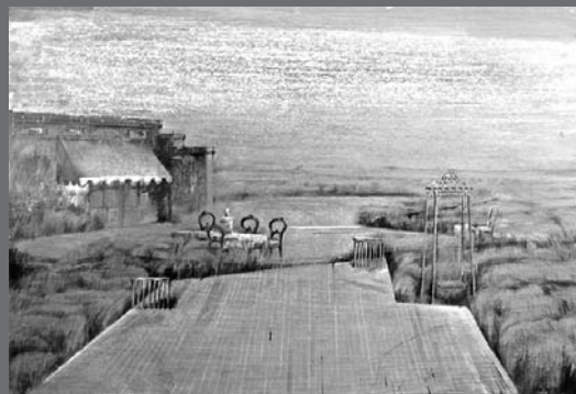
A. P. Čechov: Strýček Váňa , Národní divadlo v Oslu (1977)