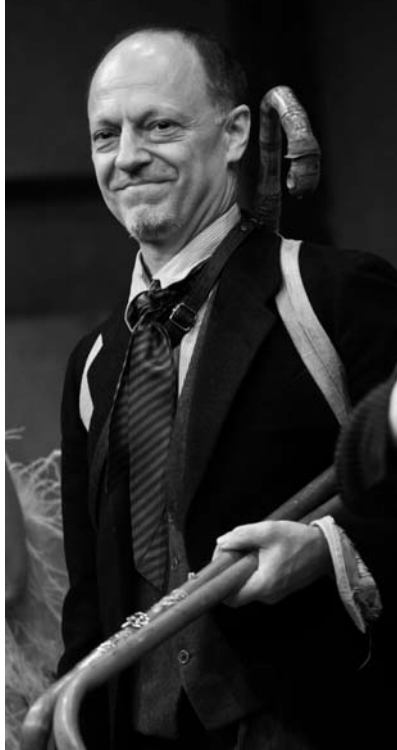
Dramatický básník Troscanini v Goldoniho Impresáriovi ze Smyrny (ČK, od r. 2006)

To bylo štěstí, že jsem mohl trochu nahlédnout do práce režiséra, kterého uznává celý svět. Vždycky přicházel s velikánskou knihou, kde měl nakreslený celý film. To pro nás bylo zajímavější než natáčení. Měl smysl pro humor a čuch na herce. Obsazoval si staré mistry – vždyť v jeho filmech hrál Eduard Kohout a Zdeňka Štěpánka si vzal právě do Ukradené vzducholoďi , aby namluvil Kapitána Nema – a dával příležitost i hercům z Ostravy, Zlína a odjinud.