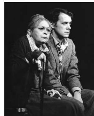
Babička v Horváthových Povídkách z Vídeňského lesa (r. L. Smoček, 1981)