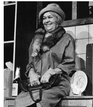
Mára v Shepardově Pravém západu (režie J. Nebeský, 1990)