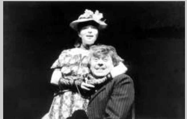
V. Havel: Žebrácká opera (režie Jiří Menzel, 1990)