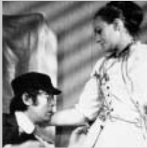
A. P. Čechov: Višňový sad (režie Jan Kačer, 1969)

„... Velice slušný chlapec. Velmi kultivovaný. Takový, který samozřejmě umí na piano a umí anglicky. Má ‚kindrštube‘. Ale ve kterém něco hraje, ve kterém je nějaká energie, která se chce projevít, i když na druhou stranu má tendenci se schovat. ...“