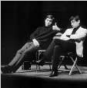
A. Vostrá: Na koho to slovo padne (režie Jan Kačer, 1966)