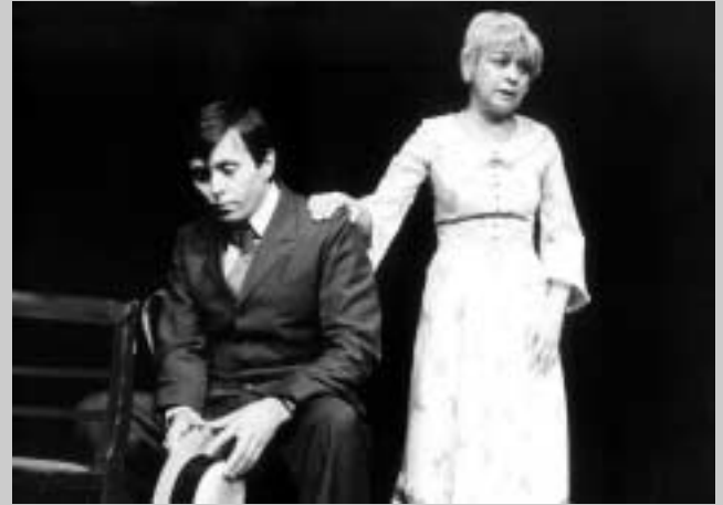
E. O'Neill: Cesta dlouhého dne do noci (režie Ladislav Smoček, 1978)