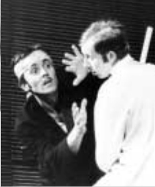
S. O'Casey: Pension pro svobodné pány (režie Jiří Krejčík, 1965)

slaví 14. prosince 70. narozeniny. V Činoherním klubu hrál v letech 1965 – 1995.