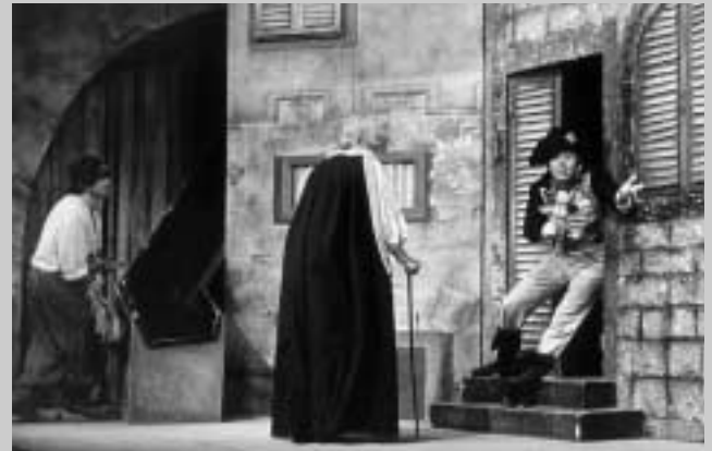
J. Vostrý: Tři v tom (režie Jiří Menzel, 1978)