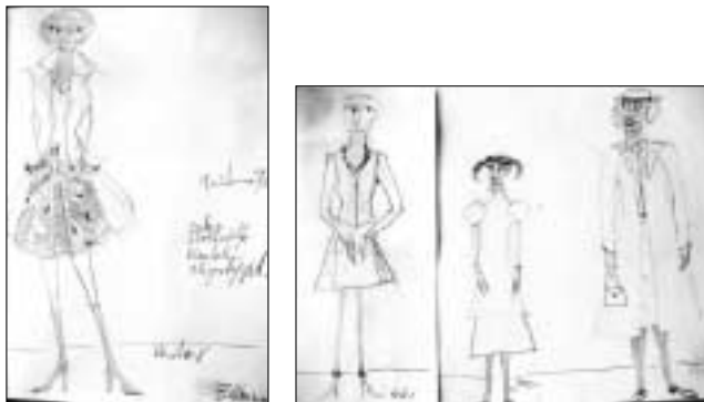
Návrhy kostýmů do inscenace U Kočičí bažiny

Děkujeme za rozhovor a Michale Čičvákové za překlad (peh)