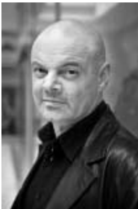
Petr Kofroň hudební skladatel