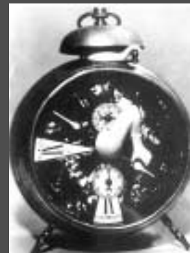
Libor Fára, Zastavte čas, 1946, foto objektu