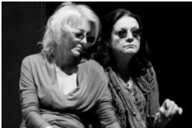
Foto ze zkoušky

Marina Carrová vykládá svá díla jako pokus o návrat k dětské radosti z hraní, protože děti „instinktivně tuší, že morálka je náš výmysl.“ Tato záměrná naivita je nejvlastnějším tématem Mariny Carrové, představuje prvotní sílu jejích nejlepších her, které autorka nemůže odolat.