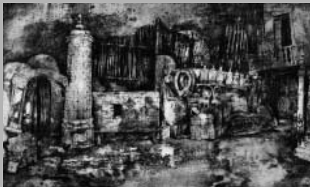
N. V. Gogol: Revizor (1967)