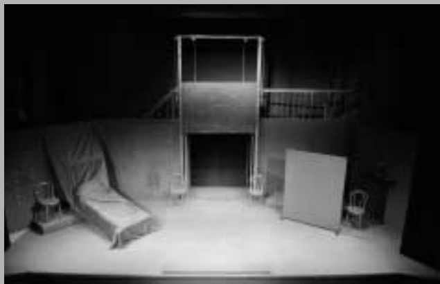
M. Kundera: Ptákovina (2008)