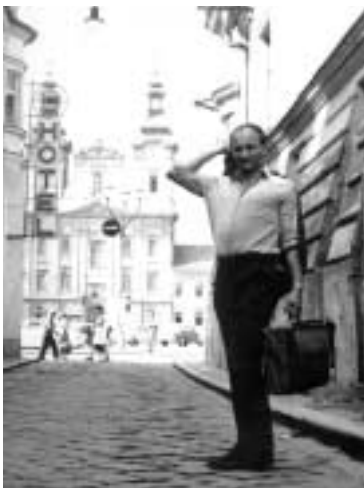
Josef Somr ve filmu Žert

Činoherní klub se v 60. letech setkal s Milanem Kunderou prostřednictvím svých herců, kteří hráli ve filmech podle jeho románů a povídek.