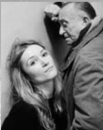
P. Landovský: Hodinový hoteliér , režie E. Schorm, 1969