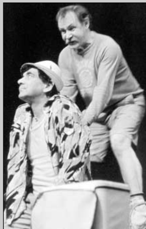
L. Smoček: Bíťva na kopci (r. L. Smoček, 1987, in Krásné vyhlídky )