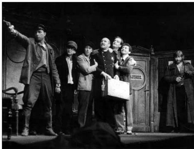
L. Birinskij: Mumraj (r. L. Smoček, 1991)