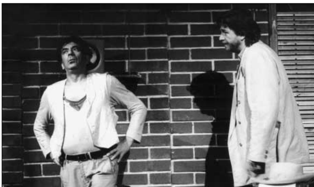
S. Shepard: Pravý západ (r. J. Nebeský, 1990)

Před lety jsem to možná rozlišoval, ale už si nepamatuju jak. Dneska – po dvanácti letech, co jsem nebyl u divadla – nemám problém s nikým a s ničím. Dostal jsem se do polohy, kdy řadu věcí nevnímám a neřeším. Prostě vím, že jsem tady od toho, abych hrál. A pokud si s režisérem rozumíme, neměl by nastat žádný problém.