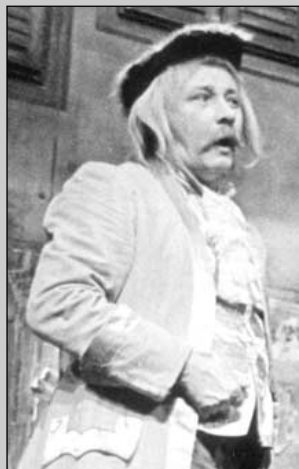
J. Vostrý: Tři v tom (r. J. Menzel, 1978)