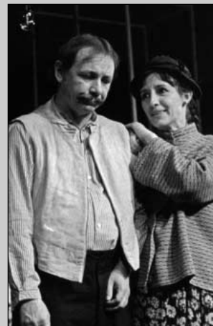
I. Ůrkény: Rodina Tótů (r. I. Krobot, 1982)