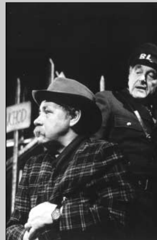
L. Smoček: Bludiště (r. L. Smoček, 1990, se Smyčkou )