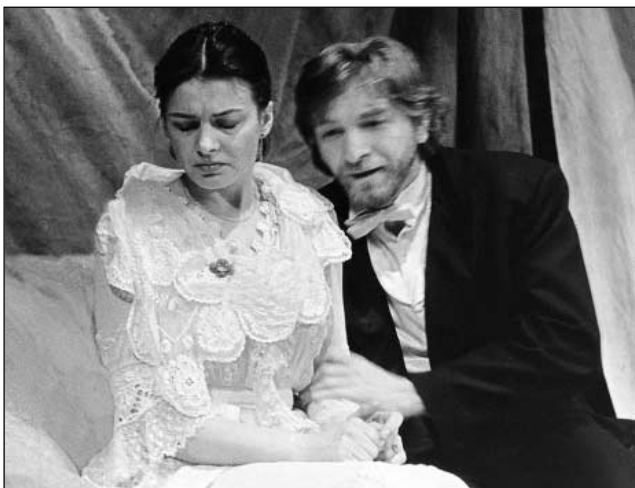
A. P. Čechov: Ivanov (r. I. Krobot, 1988)