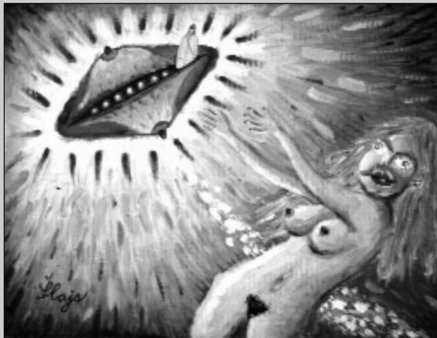
Šlajs: Jednou k ránu / © Jan Janák podle skic Ladislava Smočka, 2000

Šlajs: Lidé ve vsi říkali, že to viselo celý hodiny na obloze jako velká lucerna. A já maluju obraz, jak to letělo, víte? A dám jim ho, nebo akt jim dám, to já ještě sám přesně nevím, co jim dám, až voni zase přiletí.