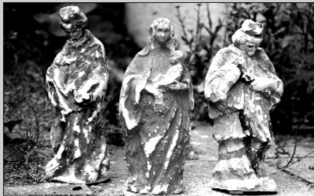
Sošky svatých