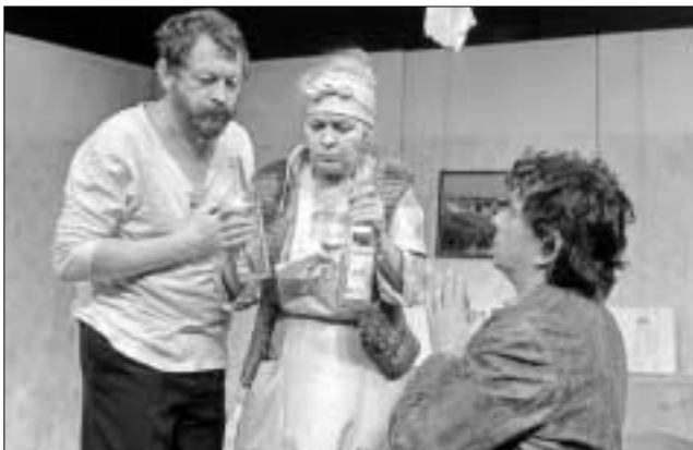
A. Vampilov: Provinční anekdoty (1987, r. I. Krobot)