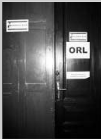
oáza, ráj, laskavost

Produktivita Rychlost Obětavost Důslednost Um Komunikace Cit Efektivita