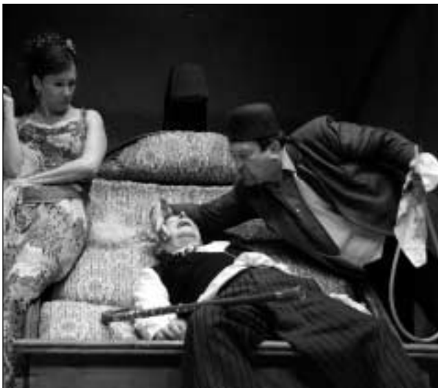
C. Goldoni: Impresárió ze Smyrny