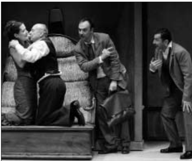
C. Goldoni: Impresário ze Smyrny