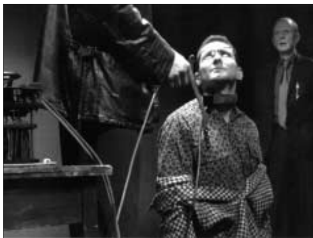
M. McDonagh: Pan Polštář (režie O. Sokol, 2005)