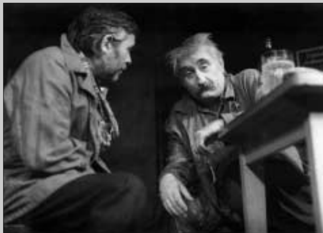
V. Havel: Audience (režie Jiří Menzel, 1990; s Josefem Abrahámem)