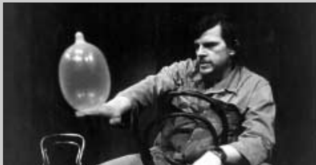
L. Smoček: Piknik (Burda / režie L. Smoček, 1965)

se narodil 3. října 1936. Byl režisérem 9 inscenací (N. V. Gogol – Revizor , A. P. Čechov – Višňový sad , M. Gorkij – Na dně atd. ) a hercem ve 3 inscenacích Činoherního klubu v letech 1965 – 1974.