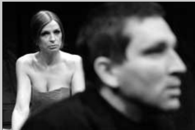
Ch. Hampton: Nebezpečné vztahy (režie L. Smoček)

To je jedno z mých trápení, které se na jedné straně alespoň zčásti pozitivně vztahuje k hercům, a na druhé – negativně – k divákům. Mohl bych se vymluvit, že mi zdražení nařídila správní rada. Ale tímhle zdražením se Čino-